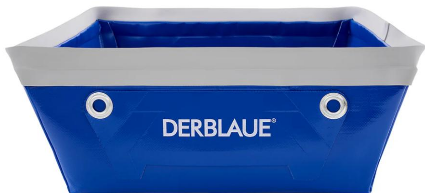
■ タブ (容量10L)