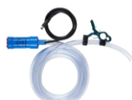
■ ホース付ポンプ (12V仕様)