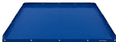
■ アンダーレイタブ (Lサイズ)