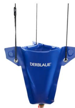
■ フレックスファンネル